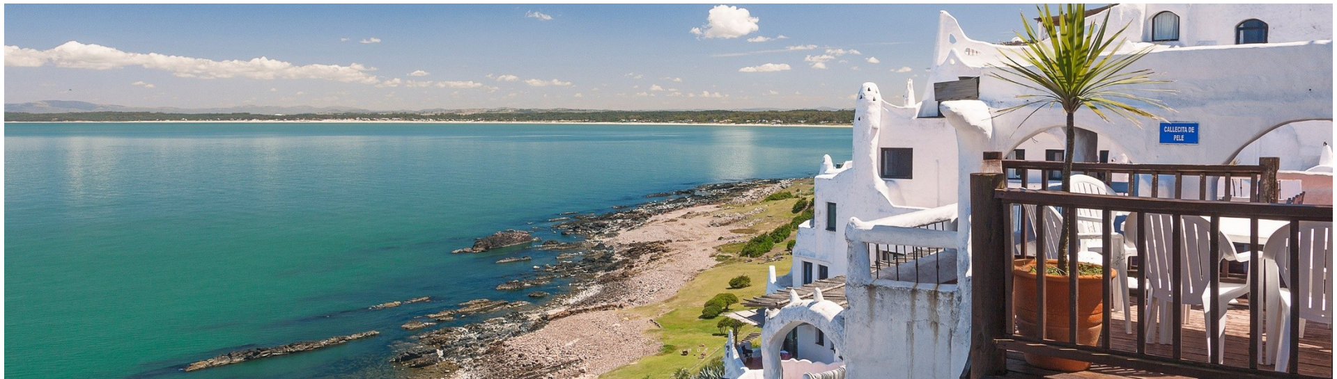
Sud America 7 Notti